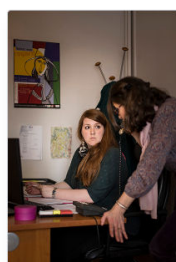
Protection judiciaire de la jeunesse : s'habiller pour tisser des liens