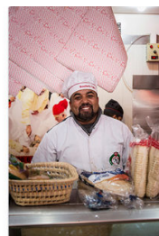
Bouchers indépendants au Maroc : des normes vestimentaires en mutation