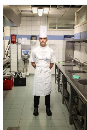
Meilleures Apprenti.es de France - cuisine : l'excellence professionnelle en tenue de travail