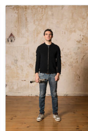
La musique d'orchestre : uniforme et variations