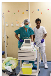
Sages-femmes : protection et couleurs du métier